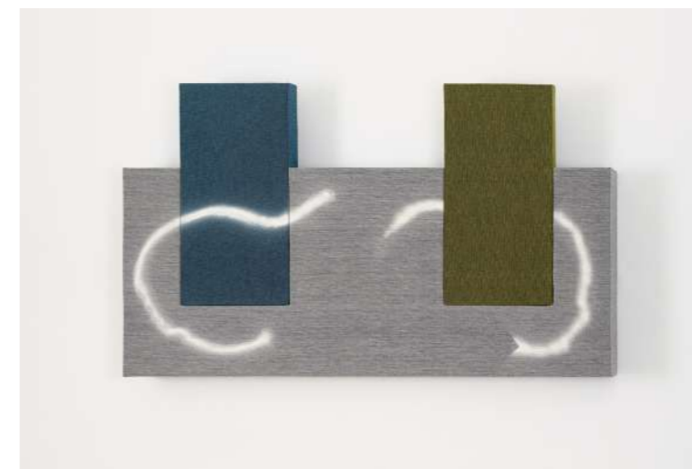
Pascal Pinaud, IKEA Four , 2023, cartons, tissus d'ameublement, peinture aérosol, aluminium, 104,5 x 174 x 19 cm. © Pascal Pinaud, ADAGP, Paris, 2026. Courtesy de l'artiste. Photo : François Fernandez.