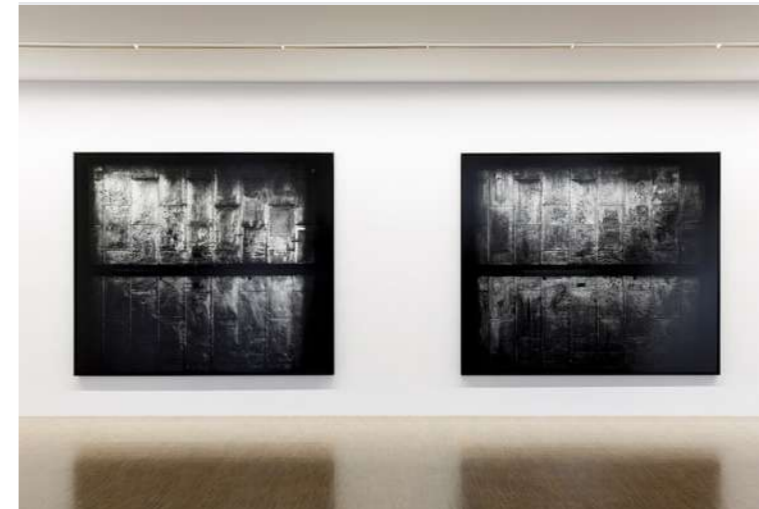
Philippe Gronon, Ascenseur n°1 et Ascenseur n°2 , 526 west, 26th street new york, 2004, tirages argentiques contre-collé sur aluminium, 215 x 250 cm chacun. © Philippe Gronon, ADAGP, Paris, 2026. Courtesy de l'artiste et de la Galerie Thomas Zander cologne.

Au-delà du discours, l'exposition est pensée comme un objet global et sensible, une fête pour le regard, un dialogue de formes et de couleurs sollicitant l'œil autant que l'esprit. Elle célèbre, à travers plusieurs œuvres proposées de chaque artiste invité, la vitalité persistante de l'abstraction, sa capacité à émouvoir, surprendre et questionner. Chaque œuvre y affirme sa singularité tout en dialoguant avec l'ensemble, dessinant les contours mouvants d'un langage en perpétuelle réinvention. Abstraction, abstractions ! ouvre un champ d'exploration où peinture, sculpture, installation, dessin, vidéo et performance se répondent, célébrant une abstraction libre, sensorielle et critique, toujours en devenir et surtout pas figée - pétrifiée - dans la mémoire de son histoire.