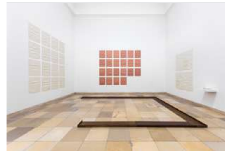
Franz Erhard Walther, Rahmen, geöffnet , 1975, acier, 7 éléments, 200 x 37 x 8 cm. © Franz Erhard Walther, ADAGP, Paris, 2026.