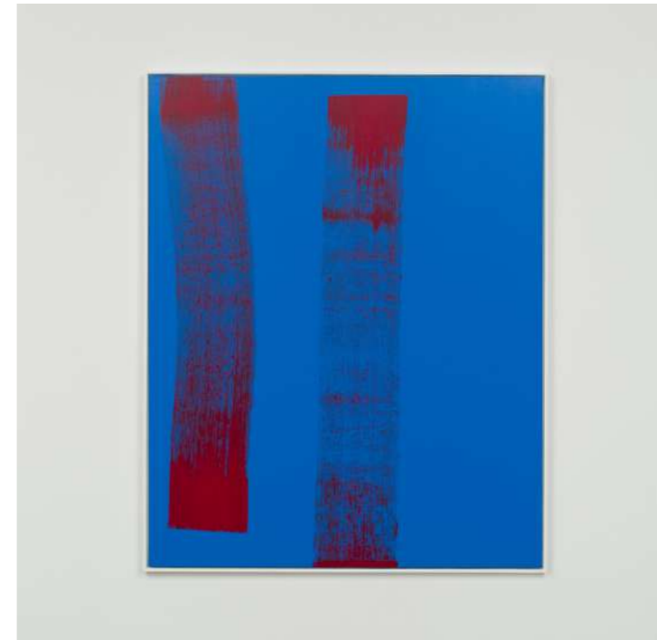
Alain Séchas, Monaco 6 , 2021, acrylique sur toile, 162 x 130 cm. © Alain Séchas, ADAGP, Paris, 2026. Courtesy de l'artiste et de la Galerie Laurent Godin Arles.

FRANZ ERHARD WALTHER (1939), artiste allemand, développe une approche participative de la sculpture qui reconfigure la place du spectateur. Chez lui, l'action devient sculpture, rompant ainsi avec l'idée de l'œuvre figée et immuable.