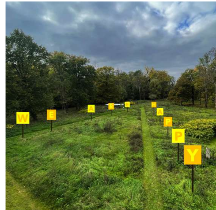
Christian Robert-Tissot, We are Happy , 2026, 10 panneaux de bois, 110 x 90 cm chacun. Visuel : modélisation de l'oeuvre dans le parc des Tanneries. Courtesy de l'artiste et Les Tanneries CACIN, Amilly.