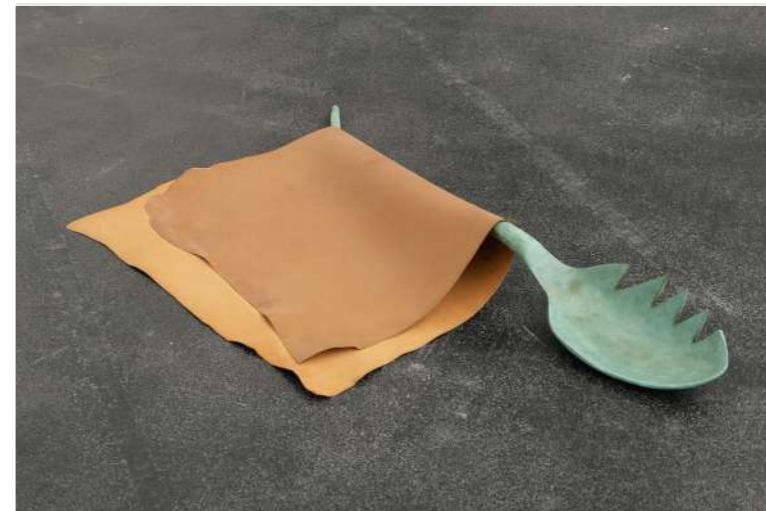
Katinka Bock, Annésie , 2022, bronze, cuir, 12 x 182 x 110 cm Vue de l'exposition Silver , Crac Occitanie - Sète, 2023