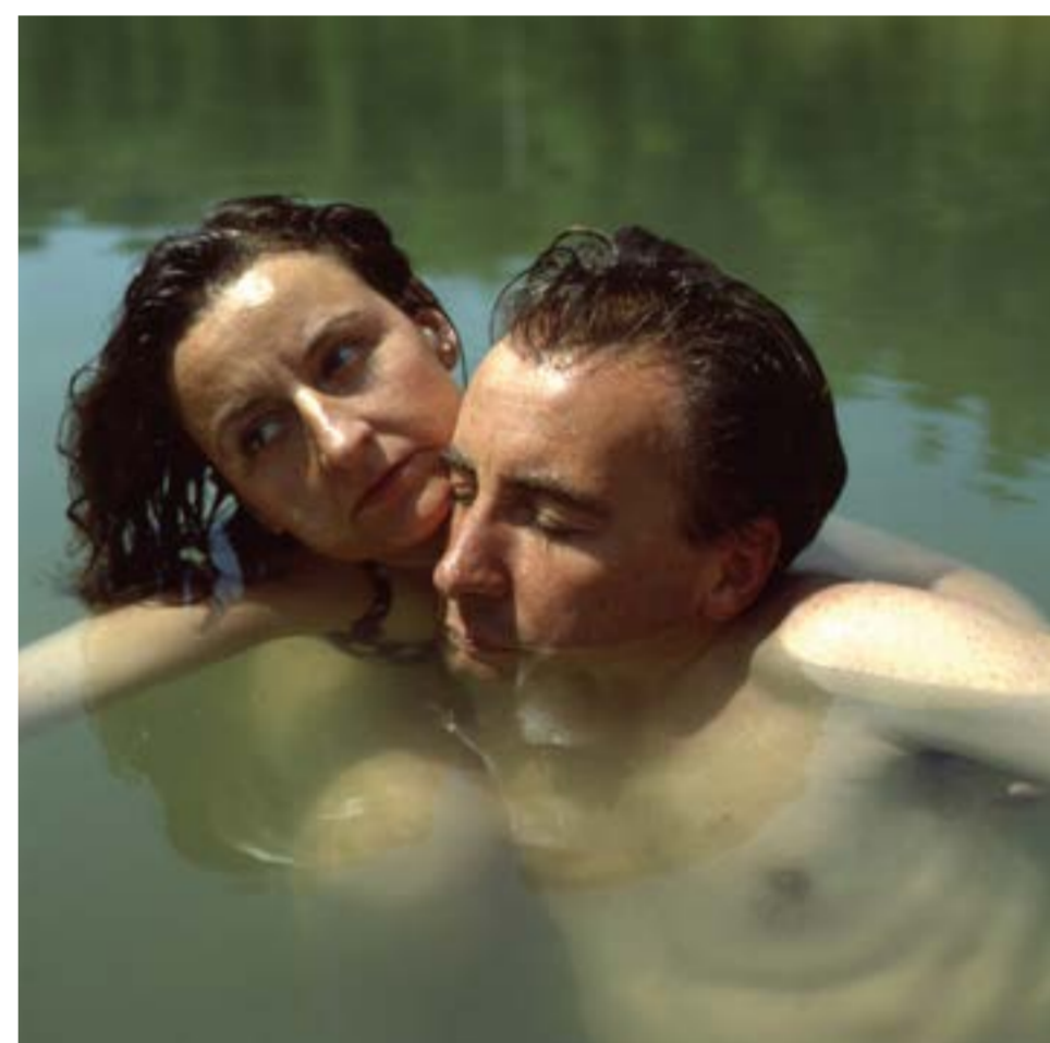
Les Vivants , Florence Chevallier, 1992. Photographie argentique, 60 x 60 cm ©Florence Chevallier, ADAGP, Paris, 2026

Dans un cas comme dans l'autre, on rit devant les encombres. Avec finesse, Forster moque la bienséance de la haute société. Il en peint les semblants et les émois. Woolf déplore avec ironie les relégations des femmes au silence. Pour ces deux auteur·e·s, la chambre se fait lieu de négociations. Voir, rendre visible et donner à voir requiert un dialogue entre toi et moi, des pourparlers où ressaisir nos proximités et nos distances, nos moyens et nos places, nos différences et nos ancrages.