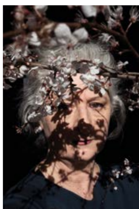
Floraisons , Florence Chevallier, 2023. Photographie numérique, 50 x 75 cm ©Florence Chevallier, ADAGP, Paris, 2026

Cette construction s'érige depuis sa seule chambre photographique, à coups de porosité : déterminée mais faillible. L'appareil photo est un passepartout. Il donne accès aux complexités du réel. Il en montre l'opacité fondamentale et pourtant invisible. Dans chaque image de