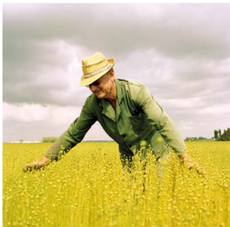
Toucher Terre (Nord) , Florence Chevallier, 2012. Photographie argentique, 100 x 100 cm

La chambre photographique de Florence est indissociable de « la chambre à soi » nécessaire pour qu'advienne un travail artistique, selon Virginia Woolf. En pionnière