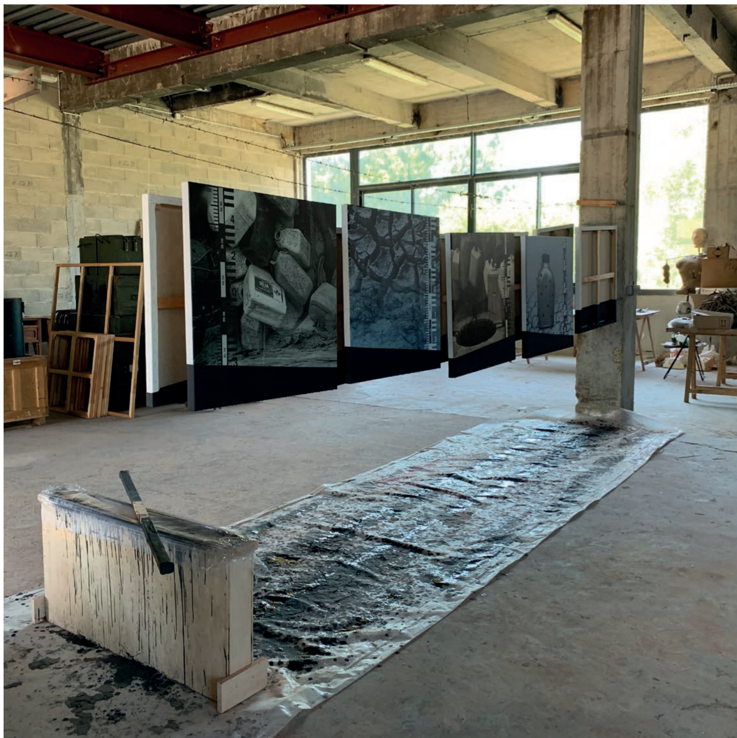
Studio Orta – Les Moulins, vue d'atelier, juin 2020 / Photo : Éric Degoutte / Courtesy des artistes et des Tanneries – CAC, Amilly