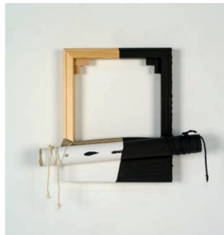
Jorge Orta, Invisible Painting: Sumergidos 1976, 2019