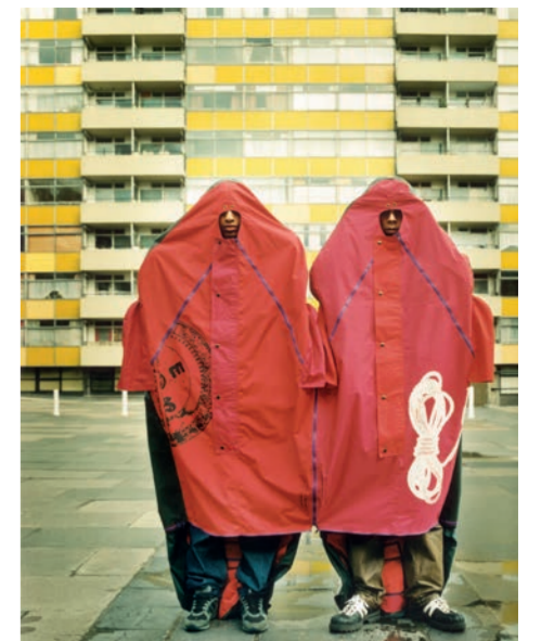
Lucy Orta, Refuge Wear Intervention London East End, 1998

Assurément. Insidieusement. Parfois dramatiquement. Lucy et Jorge Orta en prennent la (dé)mesure en (dé)multipliant les signes. Collectes ou échantillonnages, recensements et préservations, assemblages et productions, tout se met au diapason d'un sample possible, d'une mise en boucle opérée entre ces états des choses, du monde. Les liens qu'ils tissent constituent la trame d'un filtre à travers lequel Lucy + Jorge Orta font acte de médiation et se déterminent en catalyseurs des attentions, architectes de formes d'usages ou de vies pensées face à l'instabilité du monde et à la tourmente des éléments.