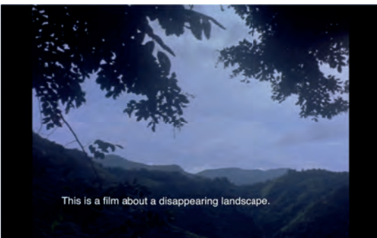
Beatriz Santiago Muñoz Farmacopea , 2013 photogramme courtesy de l'artiste