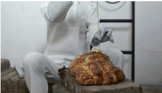
Oa4s Stillborn , 2014 photogramme