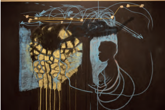
Minia Biabiany Blue spelling , 2016 photogramme